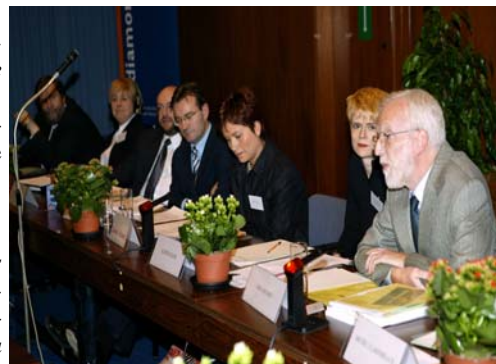
Lors de la table ronde d'ouverture de la Mediamorphose 2

Le rapport intégral regroupant les transcriptions des différentes conférences est disponible sur simple demande auprès du secrétariat du CNP.