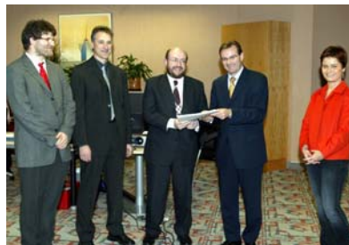
La remise officielle du rapport intermédiaire

qu'une première vague d'analyses de programmes radio et télé en comparaison avec la presse écrite. (Une deuxième vague d'analyses