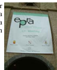
Castel dell'Ovo à Naples: coulisses historiques pour une communication moderne

la Commission européenne et les instances de régulation de l'audiovisuel. A l'ordre du jour figurent des sujets d'intérêt commun, en particulier l'application et la révision de la Directive « Télévision sans Frontières ».